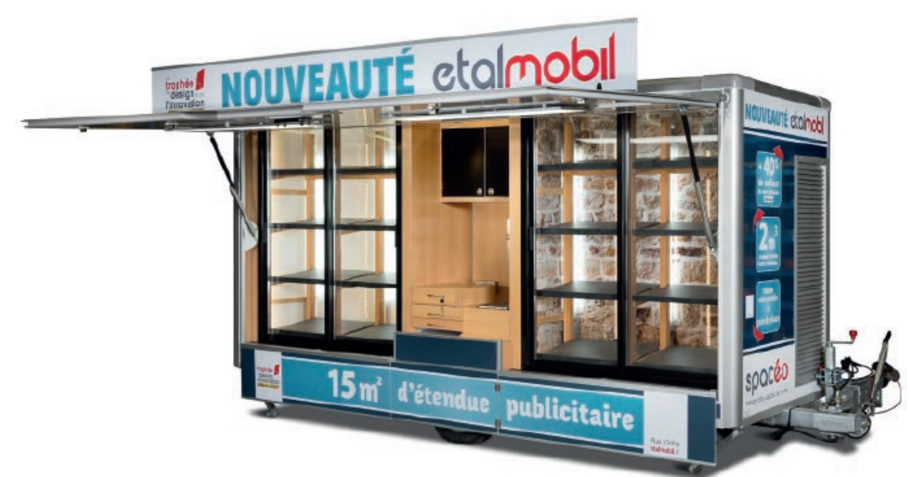
CREATION BREVETEE DE LA REMORQUE SPACEO 11m linéaires de vente en avant