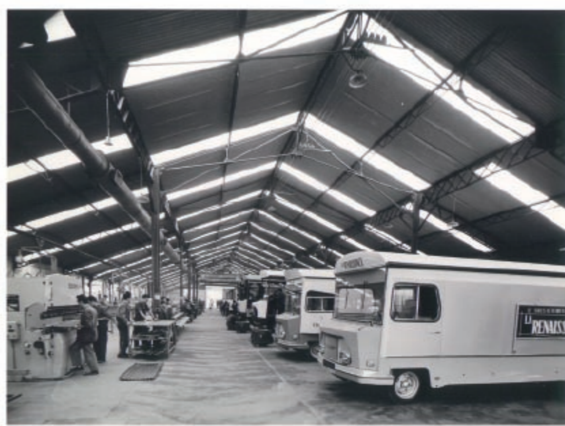
ATELIER DE FABRICATION