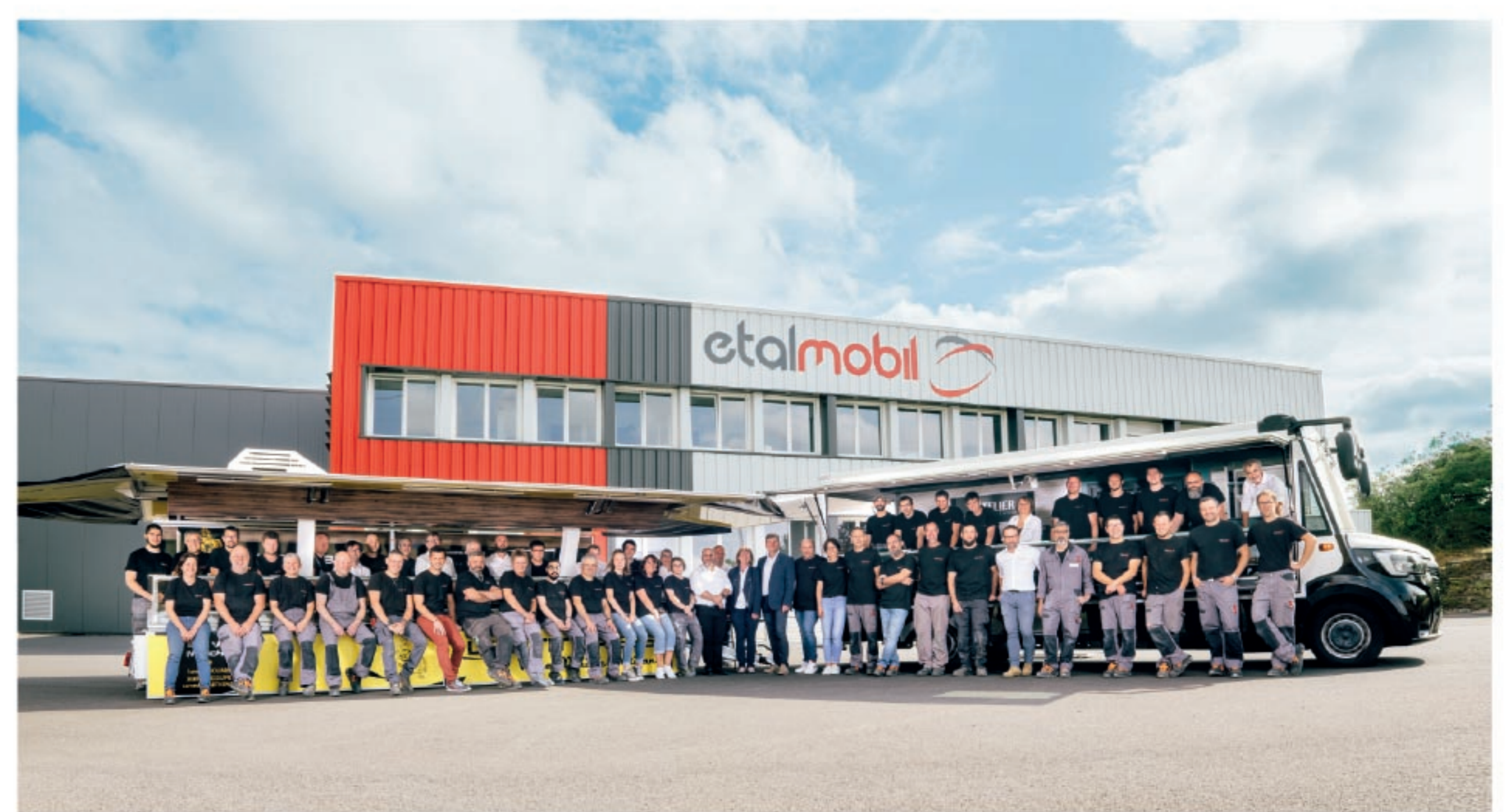
NOUVELLE FAÇADE DE L'ENTREPRISE