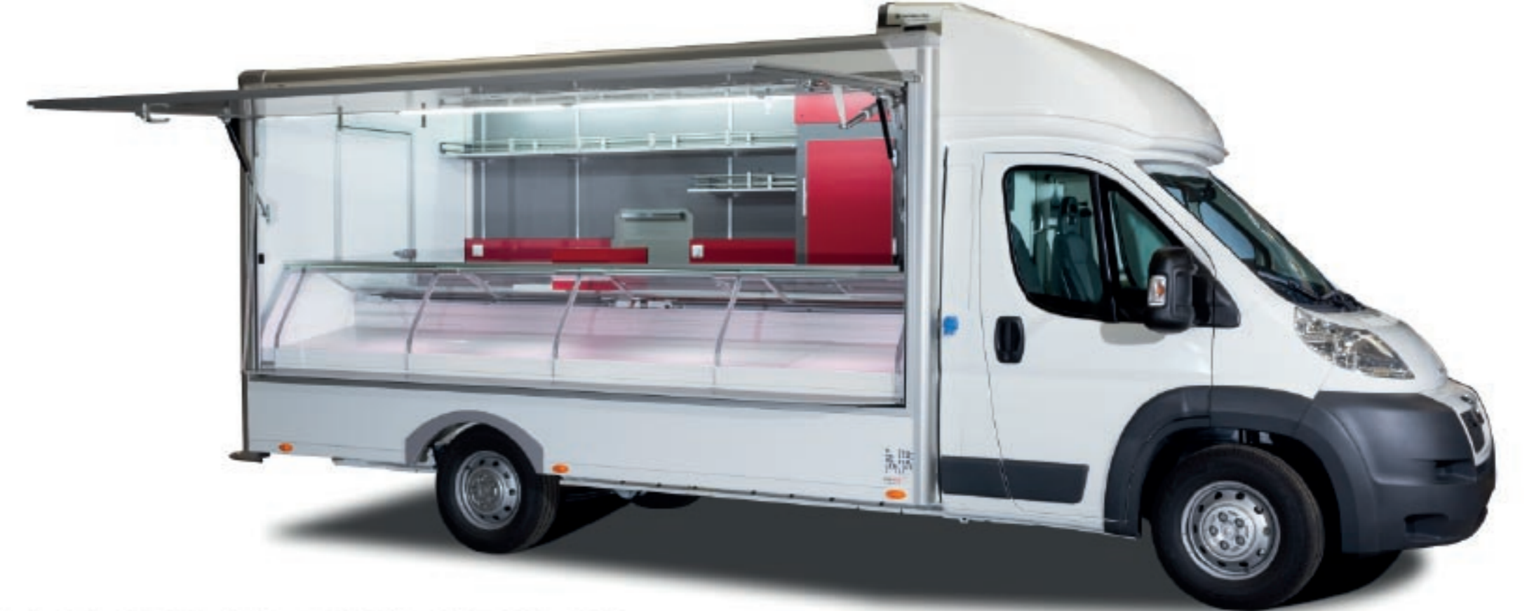
COMMERCIALISATION DE L'ECOSTAR qui s'adapte à chaque corps de métier