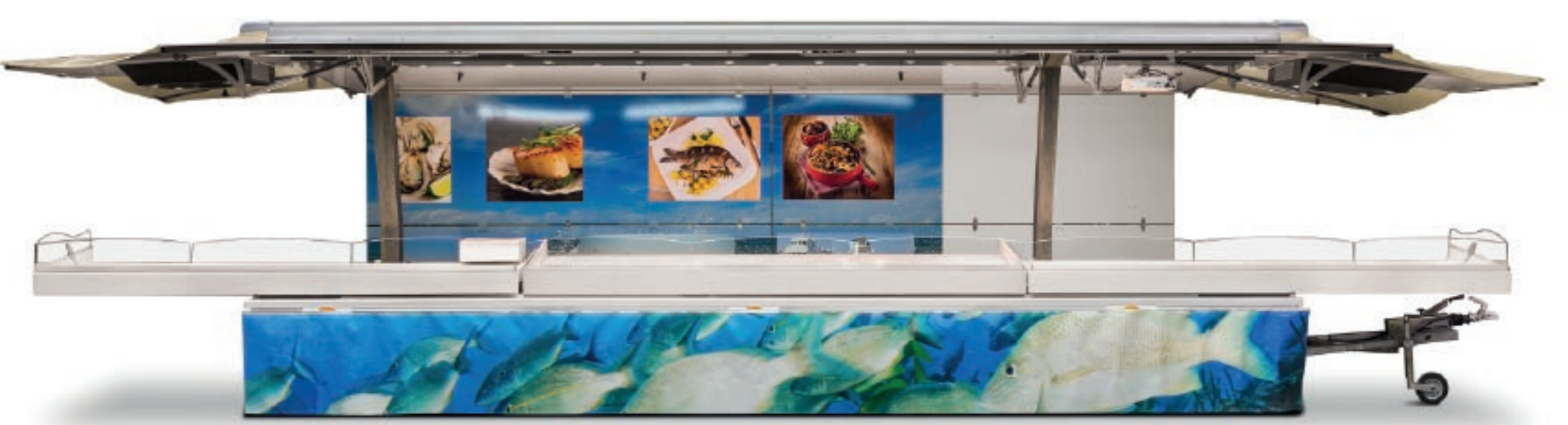
CREATION ET DEPOT DU BREVET DE LA REMORQUE PUISSANCE 3 6m sur route pour 9m de vitrine sur le marché