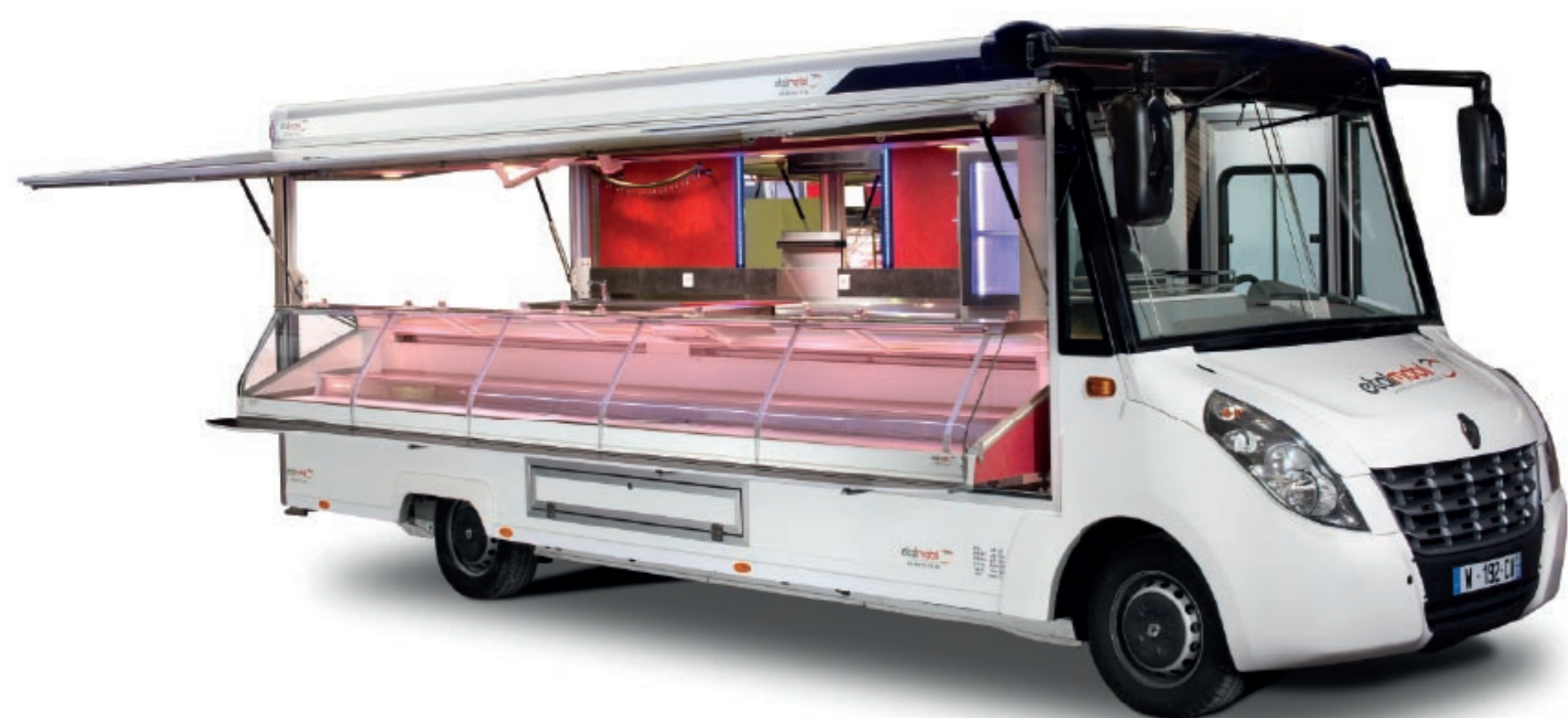
NOUVEL ETALEO SUR BASE RENAULT