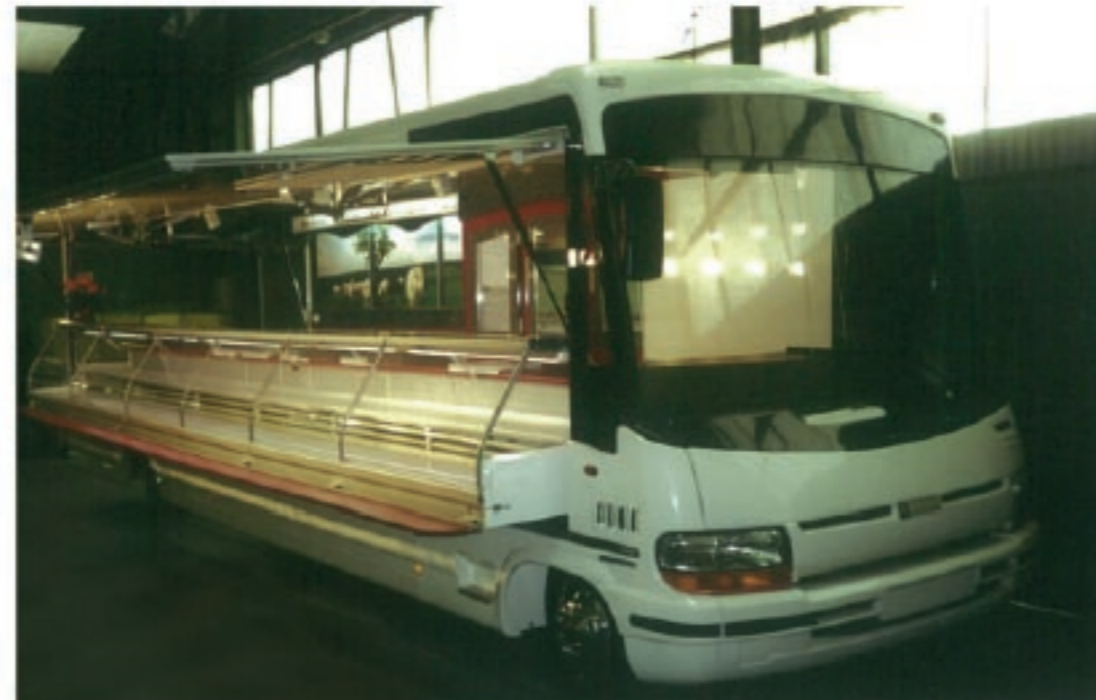
VEHICULES PANORAMIQUES 2010 et 3010