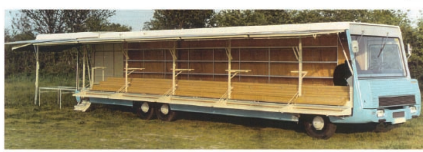
FABRICATION DES 1ERS PANORAMIQUES CB 2000 et Dyna