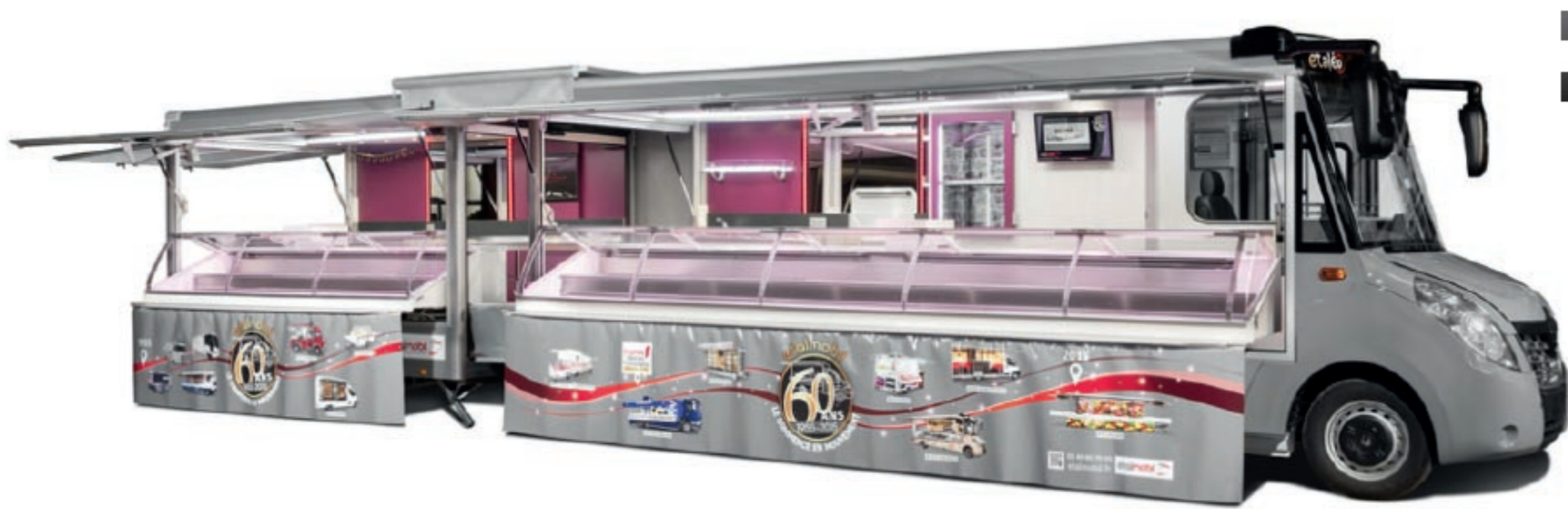
LANCEMENT DU COMBINEO