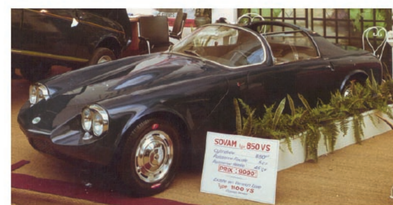
CREATION DE LA SOVAM Présentation du véhicule au Salon de Paris