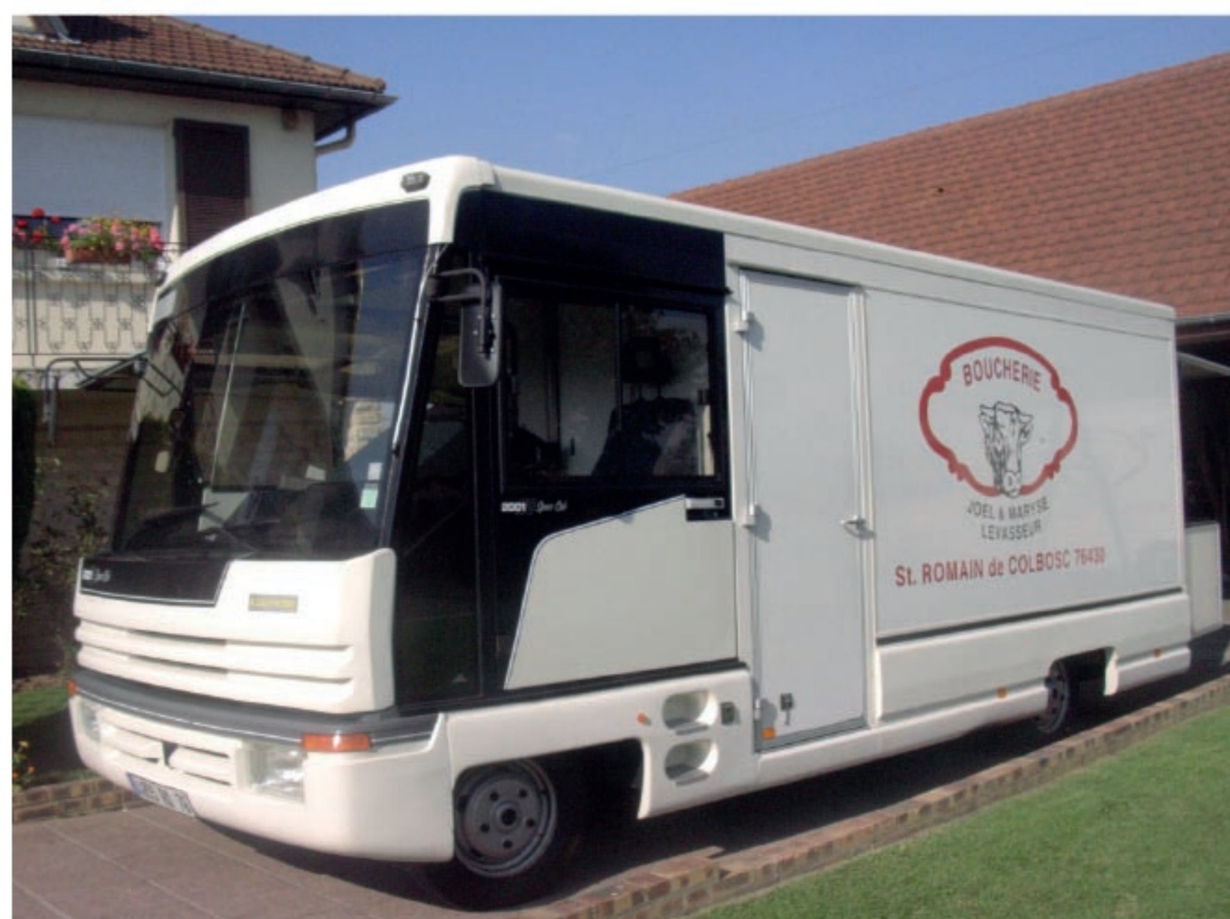
NOUVEAU PANORAMIQUE sur base Renault Master S2001 et S3001