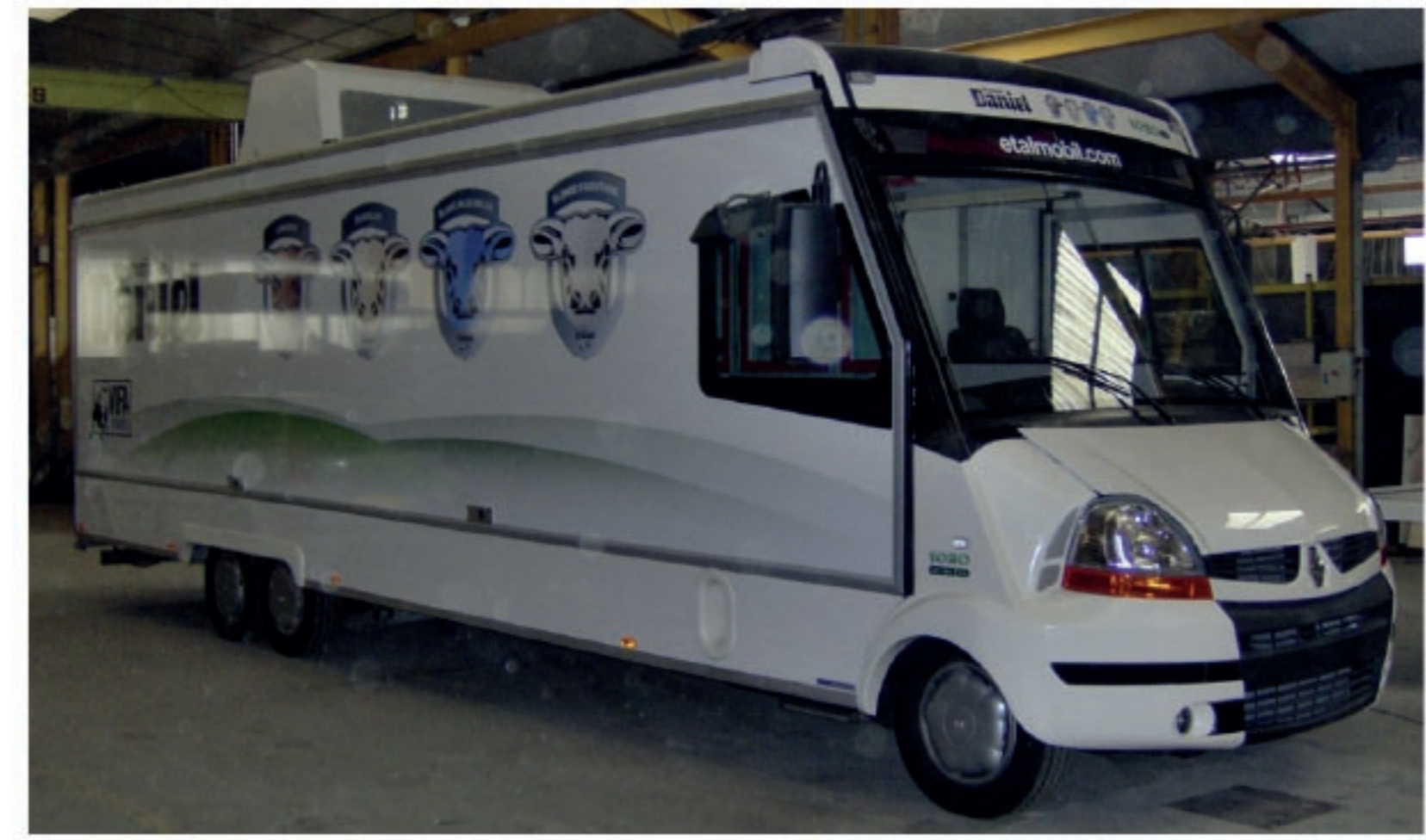
SORTIE DU 1ER PANORAMIQUE ETALEO PL