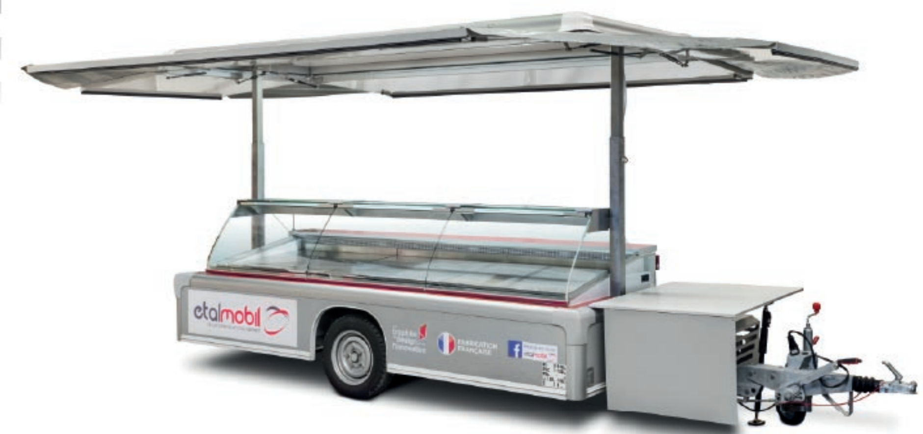
REMORQUE MALINEO spécialement dédiée aux producteurs