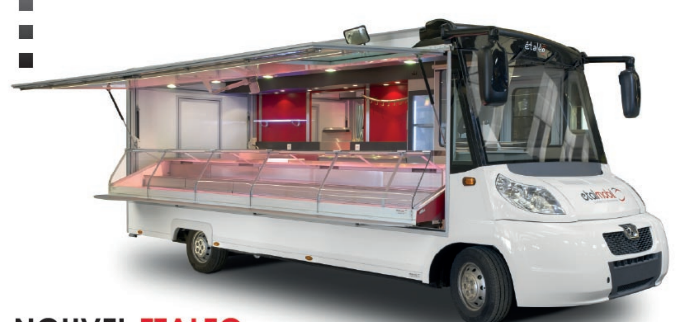
NOUVEL ETALEO SUR BASE PEUGEOT