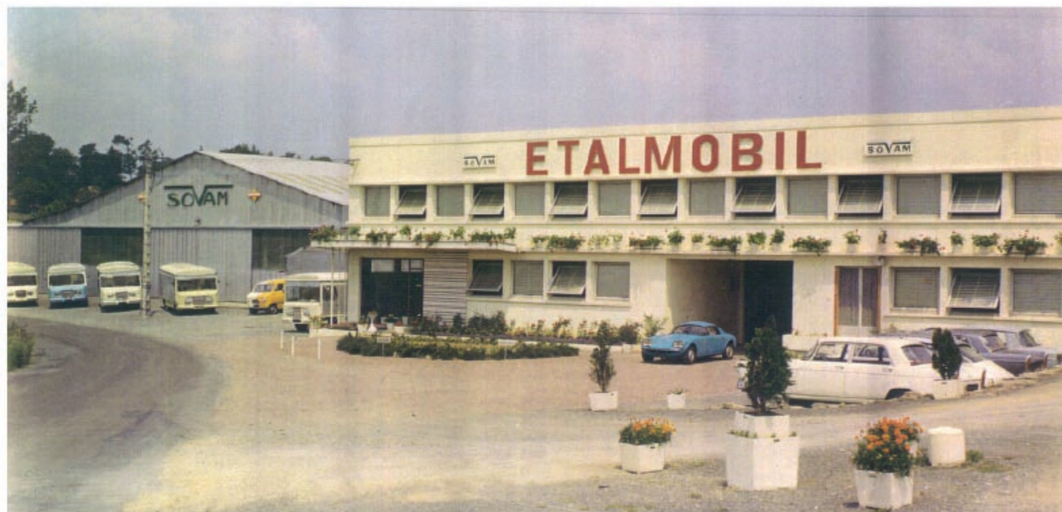
FAÇADE DE LA SOCIETE