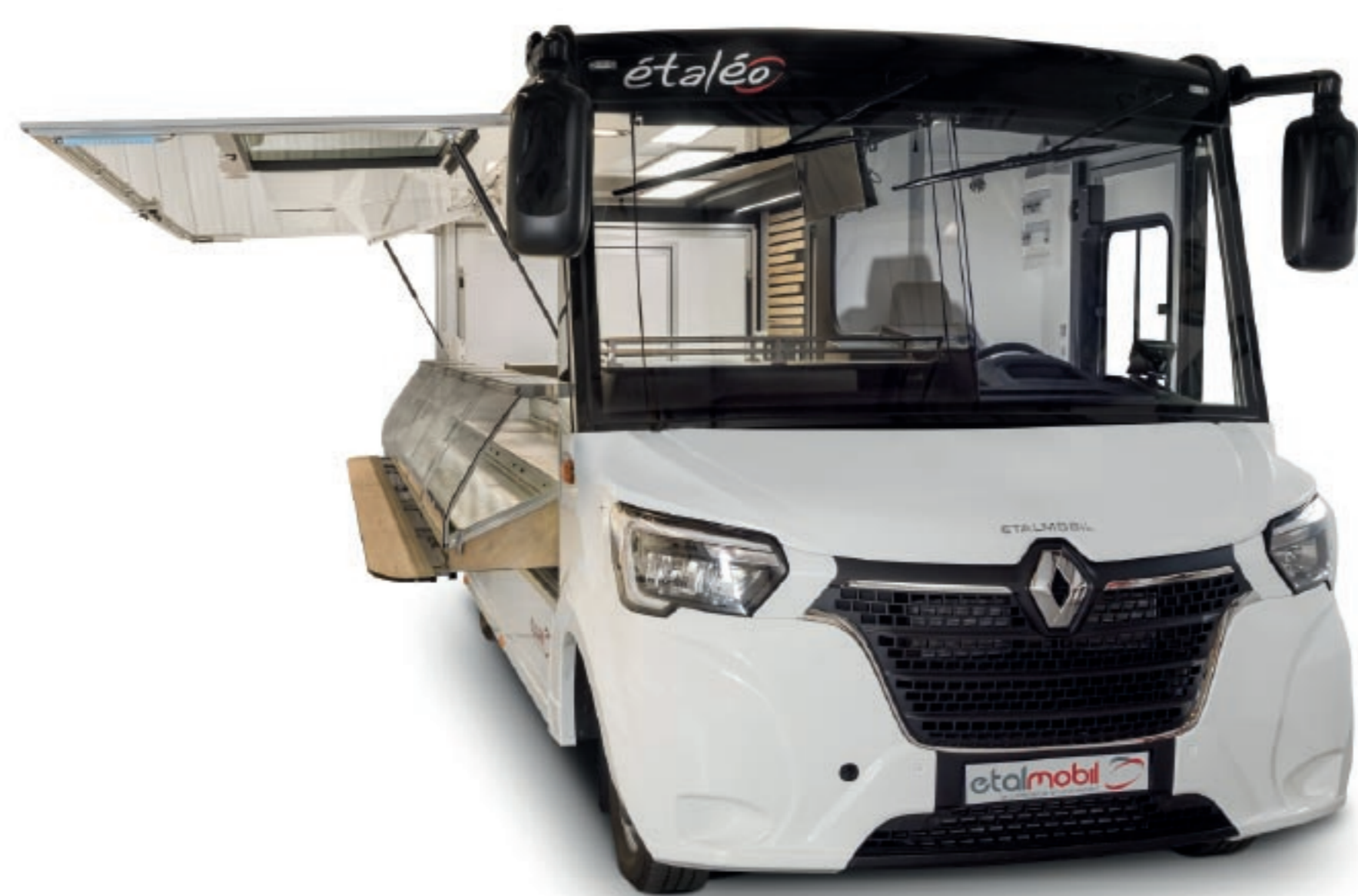
NOUVEAU DESIGN DE LA FACE AVANT DE L'ETALEO