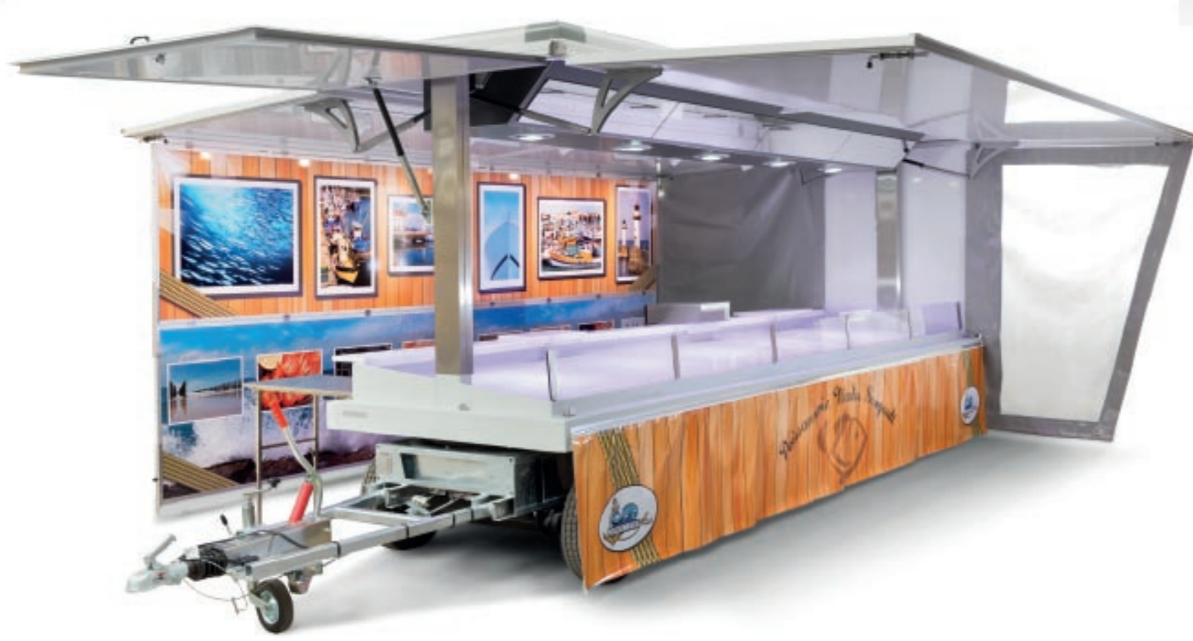
TROPHEE DU DESIGN ET DE L'INNOVATION