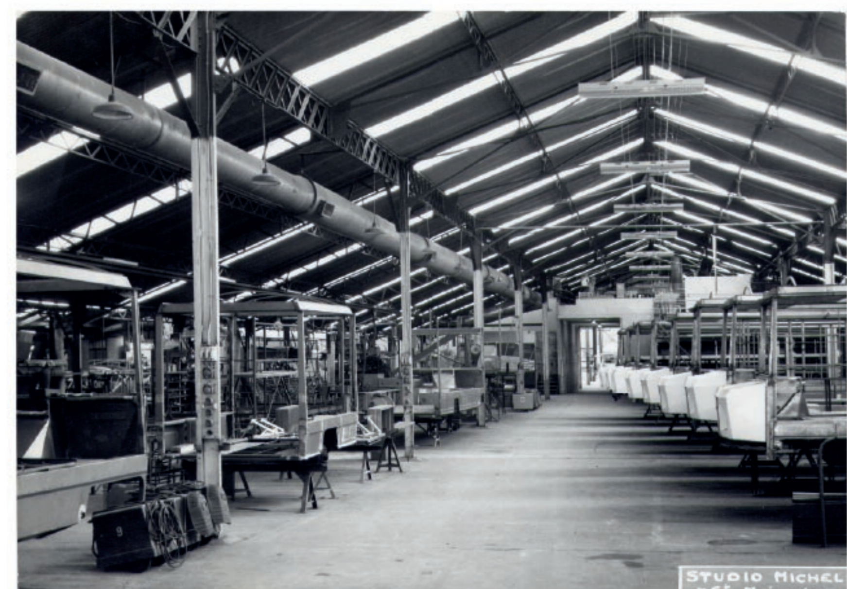
ATELIER DE FABRICATION