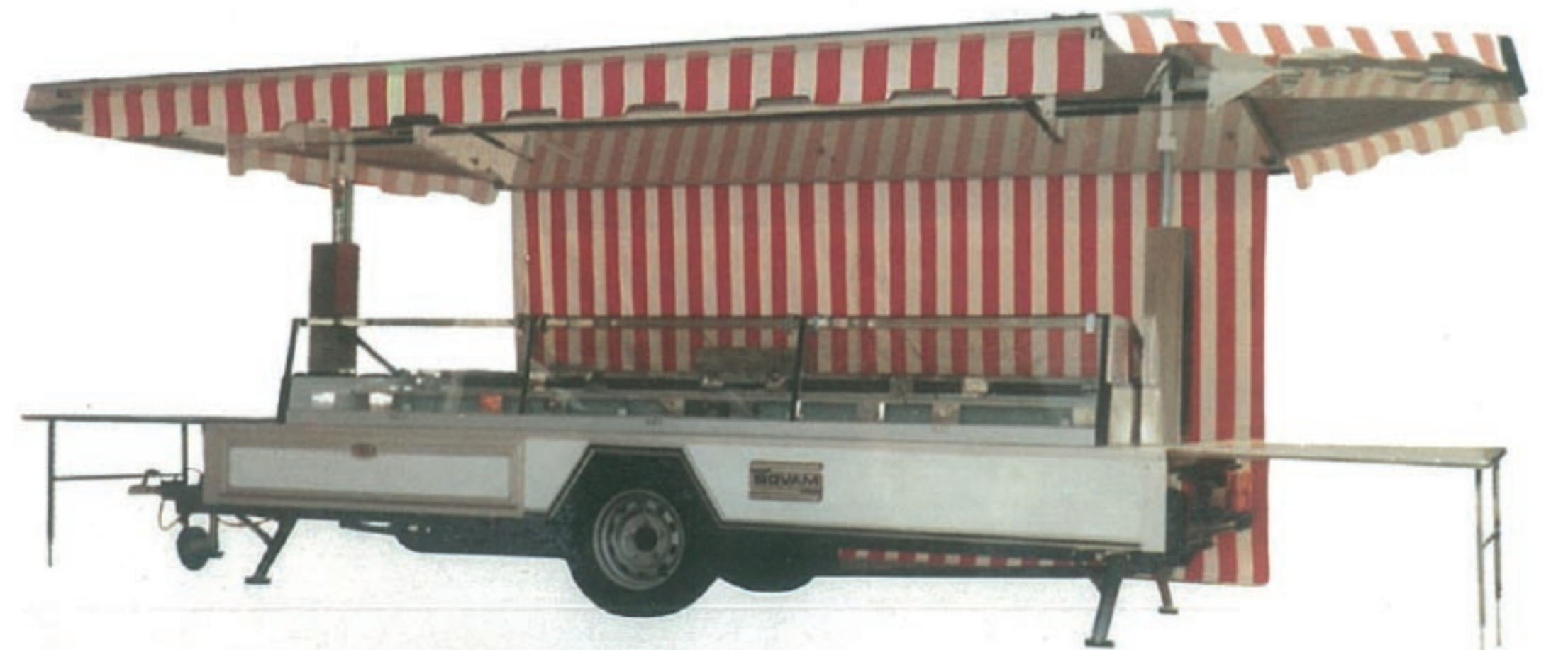
FABRICATION DES 1ERS REMORQUES ETAL