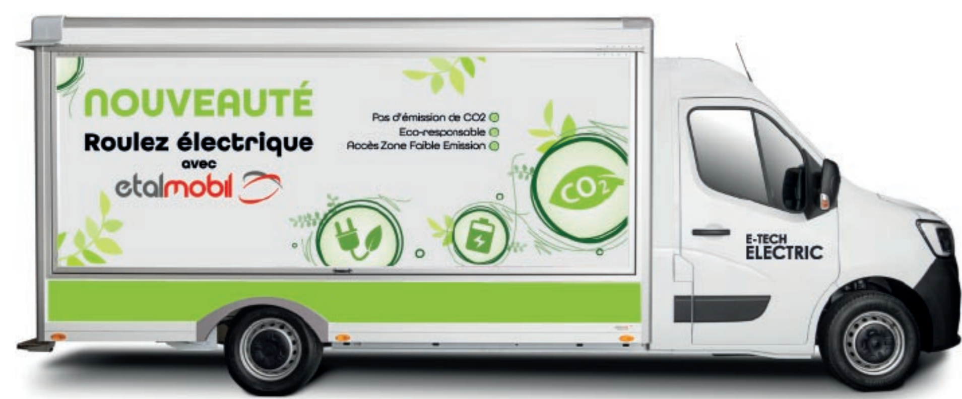
FABRICATION DU 1ER VEHICULE ELECTRIQUE