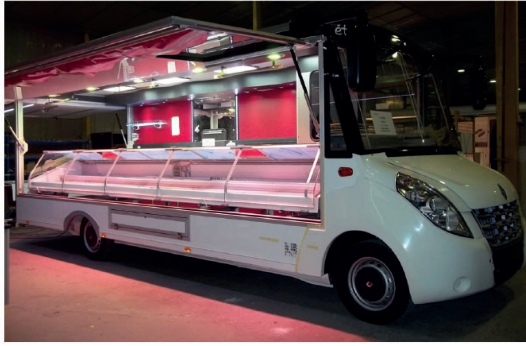
FABRICATION DU 1ER PANORAMIQUE ETALEO VL