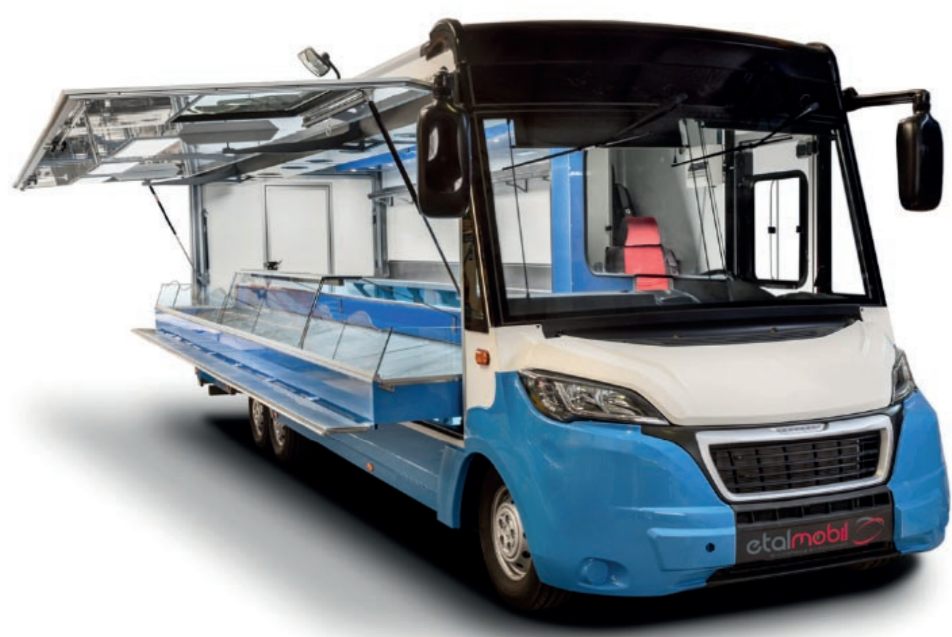
NOUVELLE FACE AVANT PEUGEOT POUR L'ETALEO