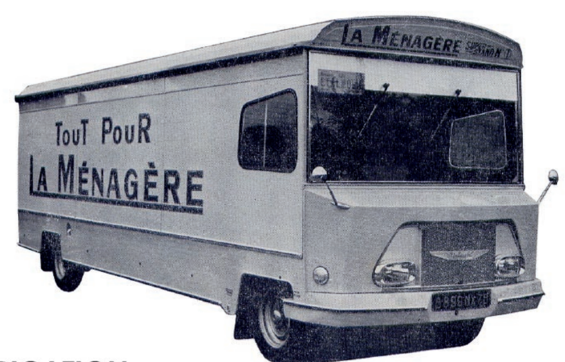
FABRICATION DES 1ERS VEHICULES MAGASINS DE MARQUE ETALMOBIL